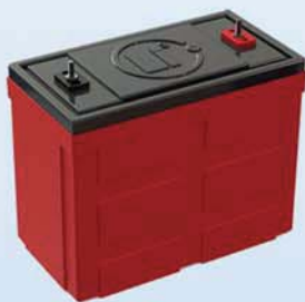
Longlife Battery Unit

FNM Hybrid System hearth is a synchronous motor realized with permanent magnets: 12 poles, properly realized for marine navigation. Adding to this there is a modular stack of lithium polymers batteries extremely compact and safe. Batteries presents protection circuits from overvoltage, undervoltage and temperature jumps. Long battery life with a balancing system of cells voltage.