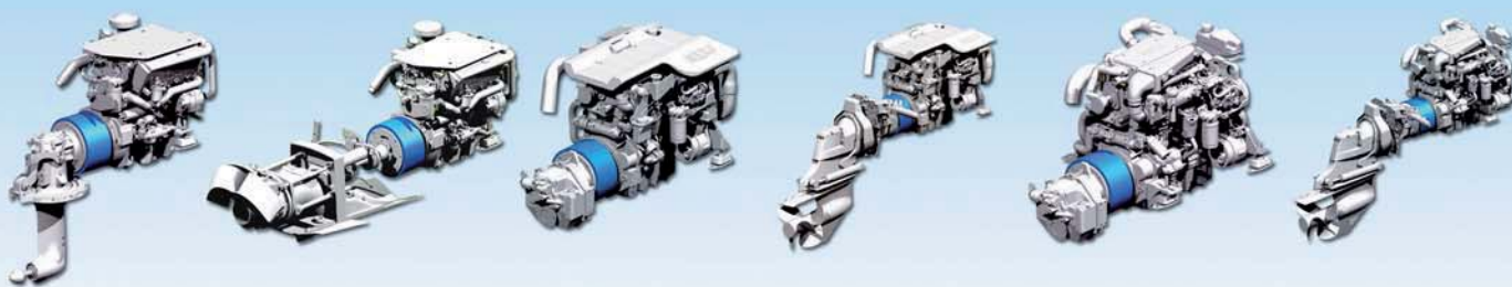
FNM HPE 80 Saidrive Hybrid