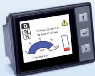
Control Panel for Blue Hybrid System